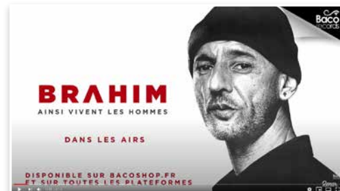
BRAHIM - « DANS LES AIRS » DISPONIBLE